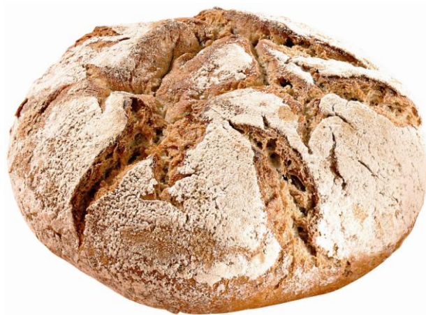
EA747 Crusty Rustic brauð 400gr. (8)