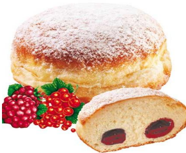
EA19 Berlínarbollur m/hindberjum 80gr. (40)