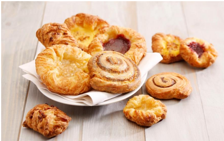
GM59199 Blandað Sætabrauð 41gr. 5teg. (120) Hálfbakað ca 18-20 mín .Þyngd 5,4 kg per ks.