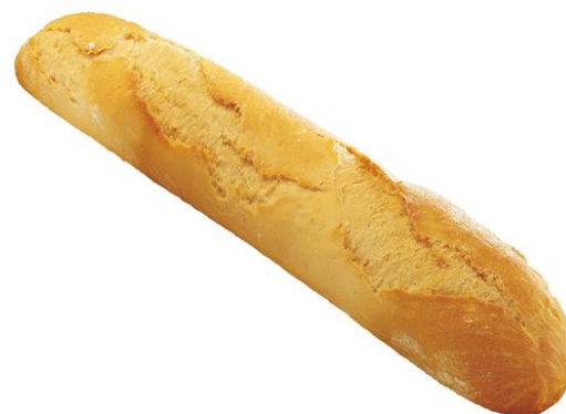
EA587 Baguett 240gr. GASTRO (28)