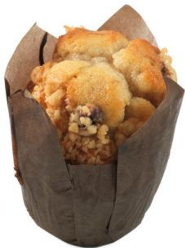
AL2301 Muffins Tulip Epla & Kanil / epli 75 gr Í kassa eru 18 stk