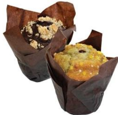
EA9119 Muffins 2 tegundir Súkkulaði & Lemon Rassberry 115gr.(20)