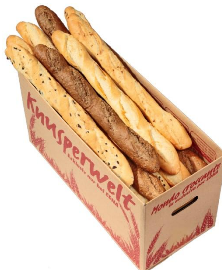
EA 201 Baguett 280.gr 5teg. (24) Hálfbakað (10-12mín)