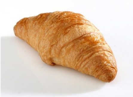
GM 41025 Mini Butter Croissant 25gr.(150)