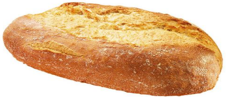
EA656 Tuscany Bread Fullbakað 500gr.(12)