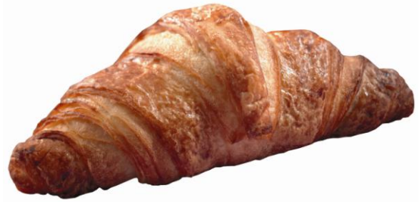
EA680 Crossant hálfbakað 60gr. 14x6cm. (100)