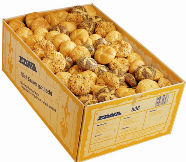
EA807 Kaiser Rúnstykki Hálfbakað 4-teg 61gr. (80)