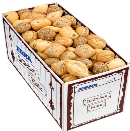
EA1 Rúnstykki bland 5 teg. Hálb 40gr. (175) Hálfbakað Grófrúnstykki (10-12mín)