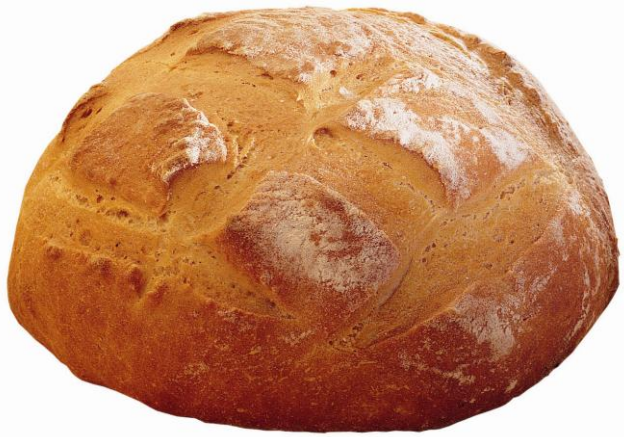
EA 657 CRUST Brauð 500gr (6)