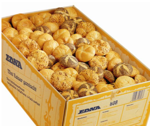
EA80 8 Kaiser Rúnstykki Hálfbakað 4-teg 35gr. (120) Hvítt, Sesam, 3ja.Korna & Heilhveiti(Ofn 10-12 min.)