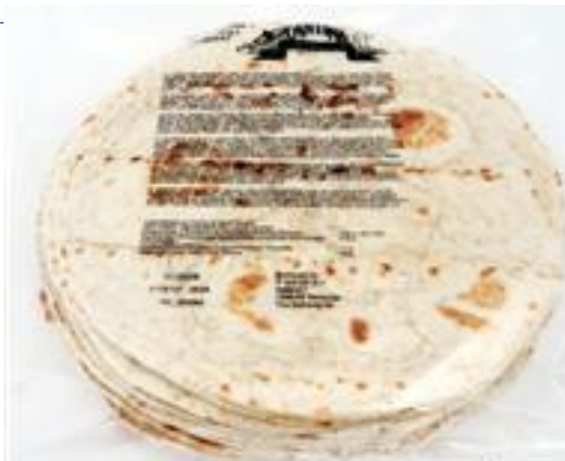
BE505882 25cm. 10" (8)