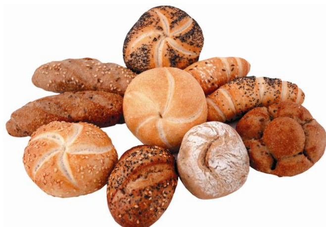
EA828 Rúnstykki BIO mjólkurlaus 31gr.5teg. (120)