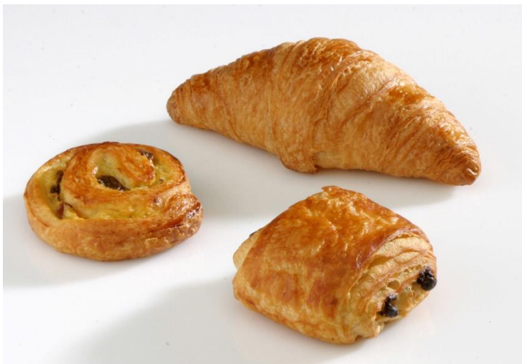
GM41099 Morgunverðarblanda 3 teg. 41gr. (120)