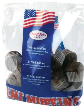
AL1173 Mini Muffins súkkulaði 15gr. 15stk í pk (14)