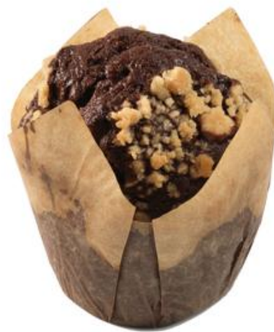
AL 2302 Muffins Tulip Súkkulaði 75gr. Í kassa eru 18 stk