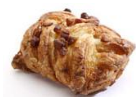
GM 59240 Mini Pecan Stykki 42gr. (120)