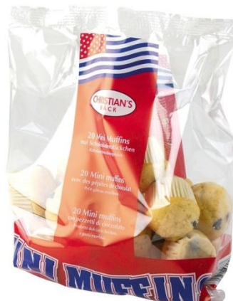
AL1172 Mini Muffins vanilla m/súkku15gr. 15stk í pk (14)