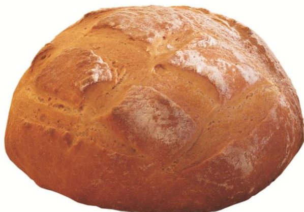
EA 657 CRUST Brauð 500gr (6)