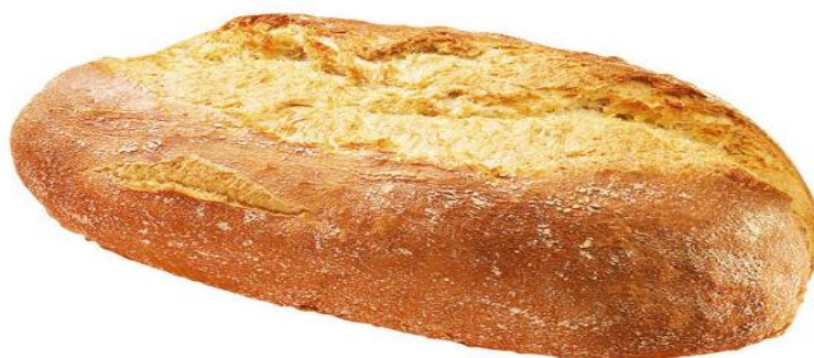
EA656 Toscana brauð 500gr. (12)