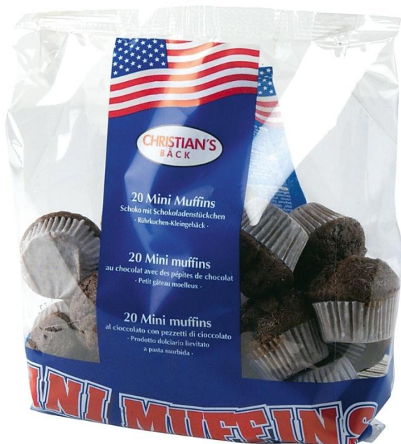
AL1173 Mini Muffins súkkulaði 15gr. 15stk í pk(14)