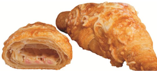
EA4600 Crossant 90gr. m/ skinku og osti (64) Hálfbakað 90 gr. 5.76 kg per ks