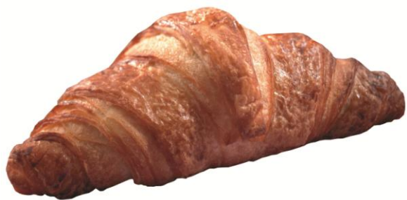
EA680 Crossant hálfbakað 60gr. 14x6cm. (100)