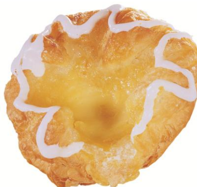
EA80216 Mini sérbakað Vínarbrauð 42gr. (12)