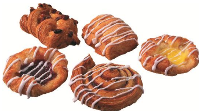
EA80510 Blandað Sætabrauð 41gr 5teg. (120) Hálfbakað ca 18-20 mín .Þyngd 4,4kg per ks.