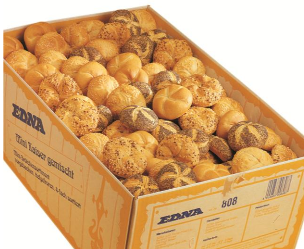
EA808 Kaiser Rúnstycki Hálfbakað 4-teg 35gr. (120) Hvít , Sesam, 3ja.Korna & Heilhveiti(Ofn 10-12 min.)