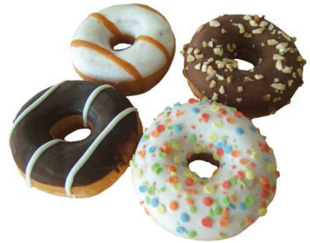
EA889 Kleinuhringir 57gr. 4 teg. (40)