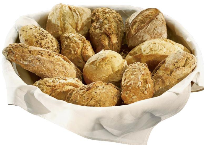
EA8190 Gourmet Selection 45gr. 8teg.(100)