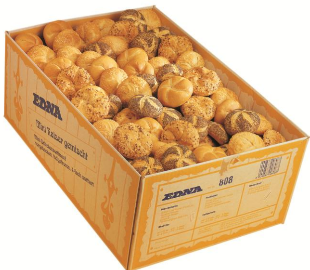
EA807 Kaiser Rúnstycki Hálfbakað 4-teg 61gr. (80)