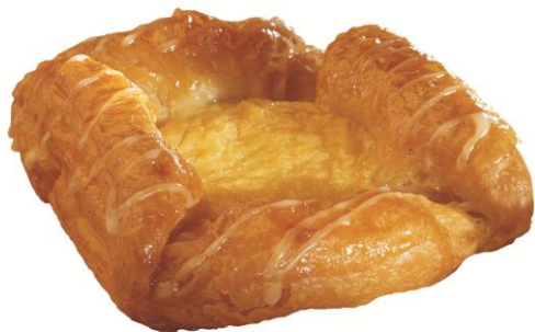
EA480 Vínarbauð hálf-bakað 110gr. (40) Hálfbakað ca 12-15 mín á 41g. Þyngd 4,kg