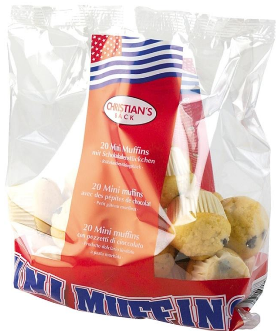
AL1172 Mini Muffins vanilla m/súkkulá 15gr. 15stk í pk(14)