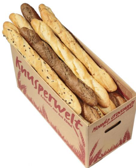
EA 201 Baguett 280.gr 5teg. (24) Hálfbakað (10-12mín)