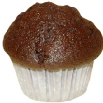
AL2202 Muffins tvöfalt súkkulaði 75gr. Plastað