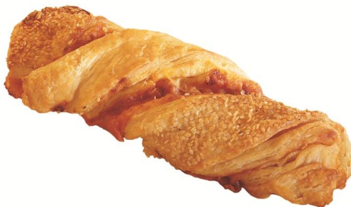
EA427 Brauðstöng m/osti (Óbakað) 140gr. (35)