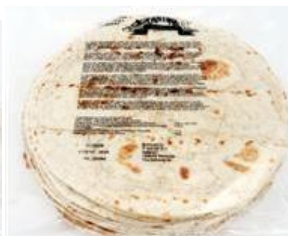
BE50882 30cm. 12" (8)