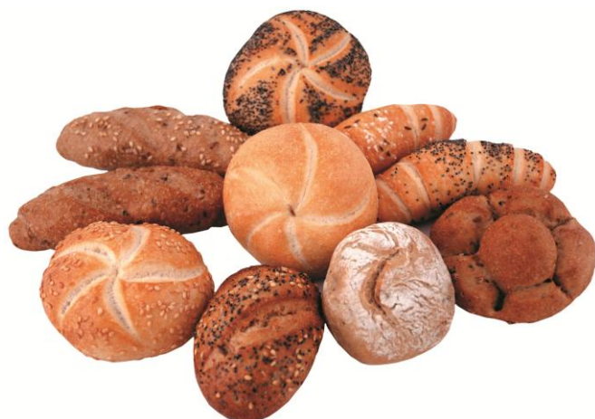
EA828 Rúnstycki BIO mjólkurlaus 31gr.5teg. (120)