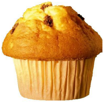
AL2203 Muffins vanilla/súkkulaði 75 gr. Plastað(30)