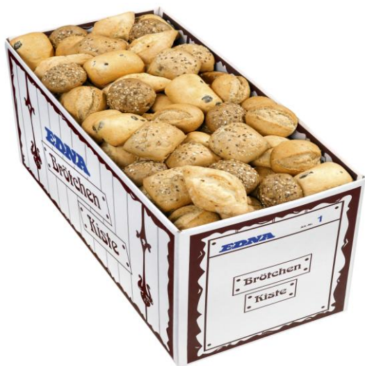
EA1 Rúnstykkja bland 5 teg. Hálb 40gr. (175) Hálfbakað Grófrúnstycki (10-12mín)