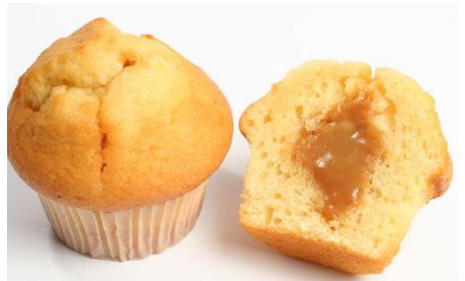
AL2205 Muffins Vanilla /karamellufylling 75gr 4stk í pk