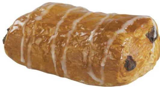
EA681 Pain Au chocolate 75gr. (80) Hálfbakað ca 12-15 mín á 75g. Þyngd 6kg