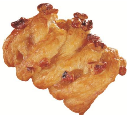
EA80215 Mini Pecanstykki 41gr. (120)