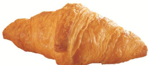
EA497 Mini Butter Croissant 25gr.(200)