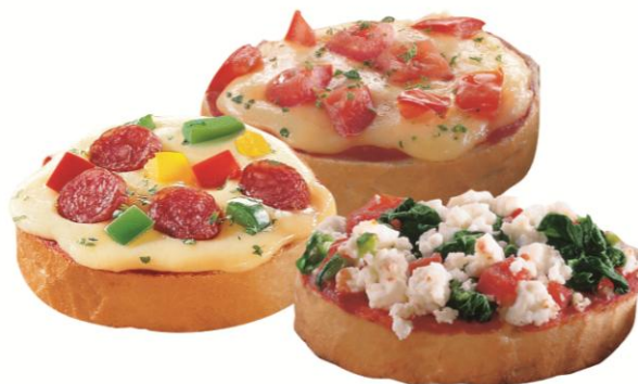
EA1185 Brucetta 38g. 3 tegundir (81)