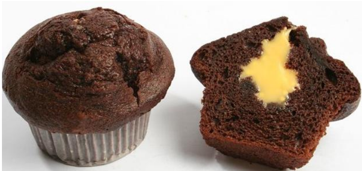
AL2206 Muffins súkkulaði /vanillufylling 75gr. 4 stk í pk (24)